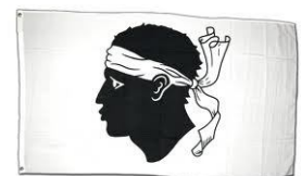
Drapeau de la Corse