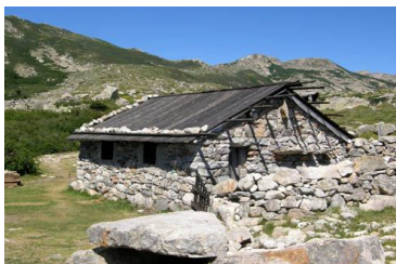
Une bergerie en montagne